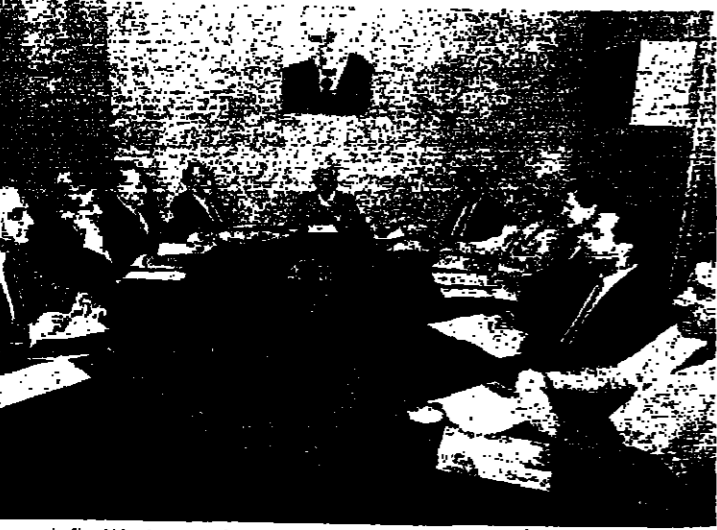
الرئيس شمعون مترئسا اجتماع المجلس السياسي الاعلى للاحرار

اعلن الرئيس كميل شمعون ان جهودنا تهدف الى غاية واحدة هي السلام. وان تعاوننا مع سوريا يضع حدا نهائياً للتقاتل في لبنان. وقال شمعون في بيان له في مقر المجلس السياسي الاعلى في حزب الوفاق الاحمر، وركزت المحادثة على القضايا السياسية والاقتصادية، خصوصا الحالة الراهنة في سوريا وجوارها. وحققه دخول القوات السورية الى المناطق اللبنانية بعد الاجتياح قتل الرئيس شمعون. جهودنا تهدف جميعا الى غاية واحدة هي السلام المطلق في لبنان مع ما يرافقه من وفاء وصدق ومحبة وتعاون بين جميع العناصر التي تؤلف الشعب اللبناني.